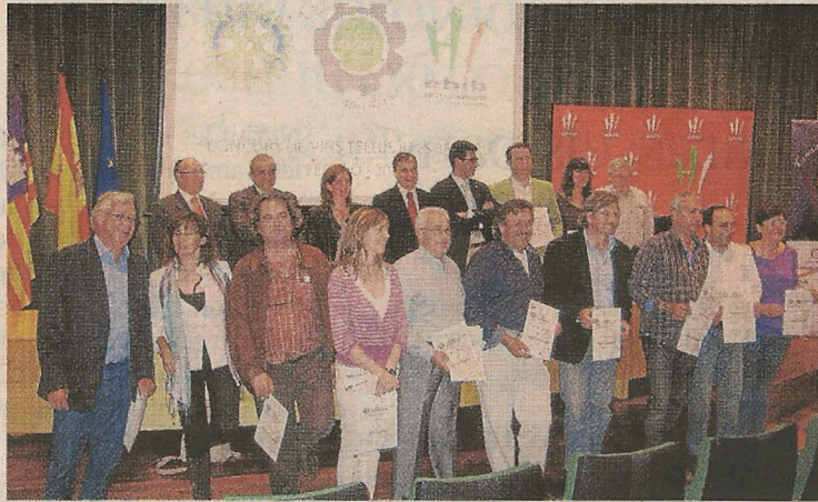
Retrat de família dels premiats a l'Escola d'Hoteleria de les Illes Balears.

El Club Rotary Palma Bellver celebrà ahir el seu concurs de vi Tellus 2010